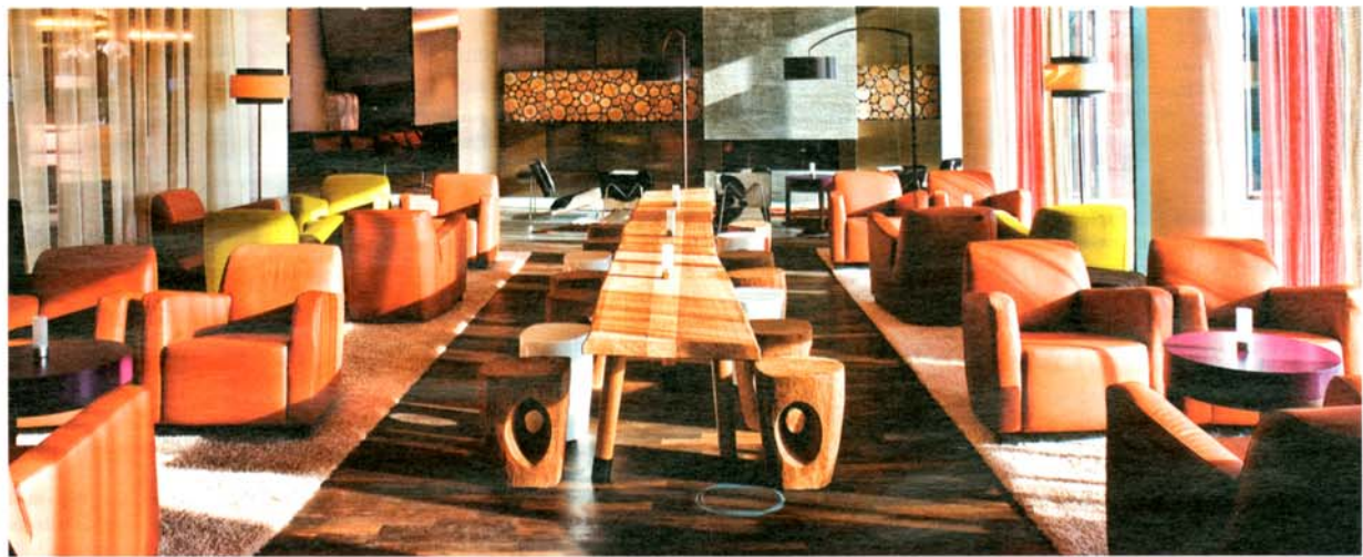
Holz trifft Polster: Möblierung im Hotel Dolce Untersleißheim von May und Kneipenstuhl im neuen Gewand von Schnieder (unten)

Dem Trend zu Farbe und zur gepolsterten Sitzfläche folgt auch die May KG . Da wird in der ganzen Palette von Rot- und Lilatönen geschwelgt, edles Grau darf dabei sein. Doch Vorsicht: „Das Mobiliar muss mit dem restlichen Konzept, also der Wandfarbe, der Atmosphäre,